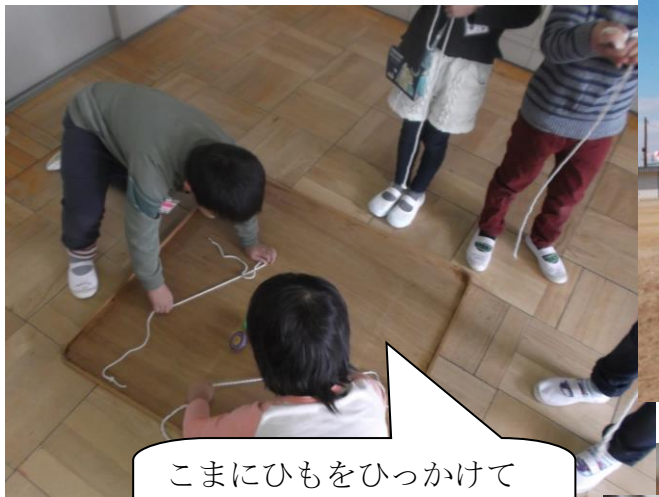
こまにひもをひっかけて 手乗せごまに挑戦だ！！

生活科の学習では、いろいろな伝承遊びをみんなで楽しんでいます。けん玉、こままわし、かるた、あやとり、お手玉、たこあげ等…。友達と声を掛け合い、どうやると上手くできるかも学んでいます。