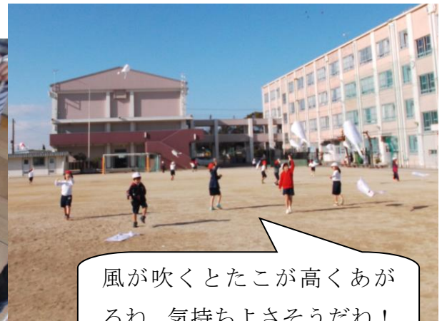
風が吹くとたこが高くあがるね。気持ちよさそうだね！