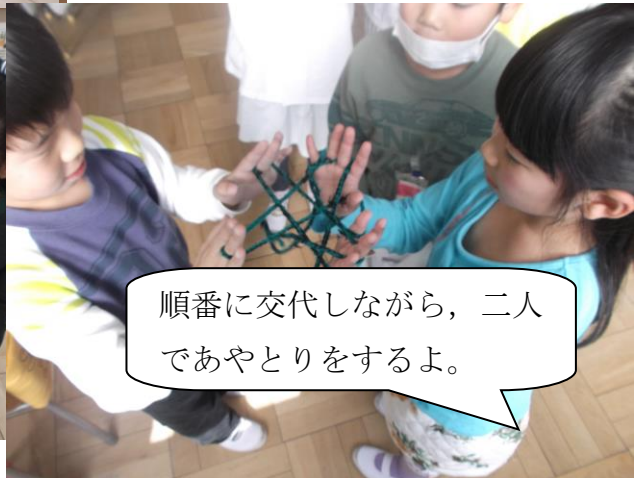
順番に交代しながら、二人であやとりをするよ。